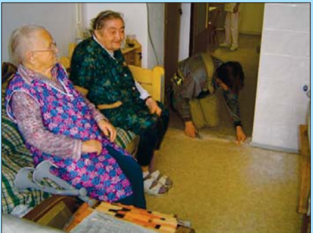
Obyvatelky domova sledují, jak řemeslníci dokončují opravu podlahy.

ních akcí v sociálních zařízeních Vysočiny a jediná, která směřuje ke zlepšení bydlení seniorů. Kraj se doposud zaměřoval na havarijní opravy třeba střech či kuchyní,“ vysvětlila radní pro kulturu, zdravotnictví a sociální věci Martina Matějková (ODS).